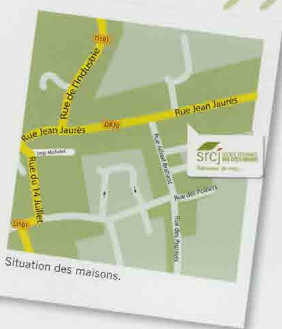
Situation des maisons.